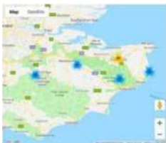
Geoposicionamento do RAMSES a um conjunto de imagens no Google Maps

O segundo instrumento analisa imagens e vídeos a nível dos bytes , do formato do ficheiro e dos píxeis, para detetar alterações e concluir falsificações. Os resultados das análises são carregados na plataforma do RAMSES.