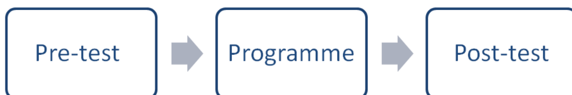
Figura 2: Exemplo de uma análise «antes e depois» básica e não experimental

Uma avaliação deste tipo teria a seguinte configuração: