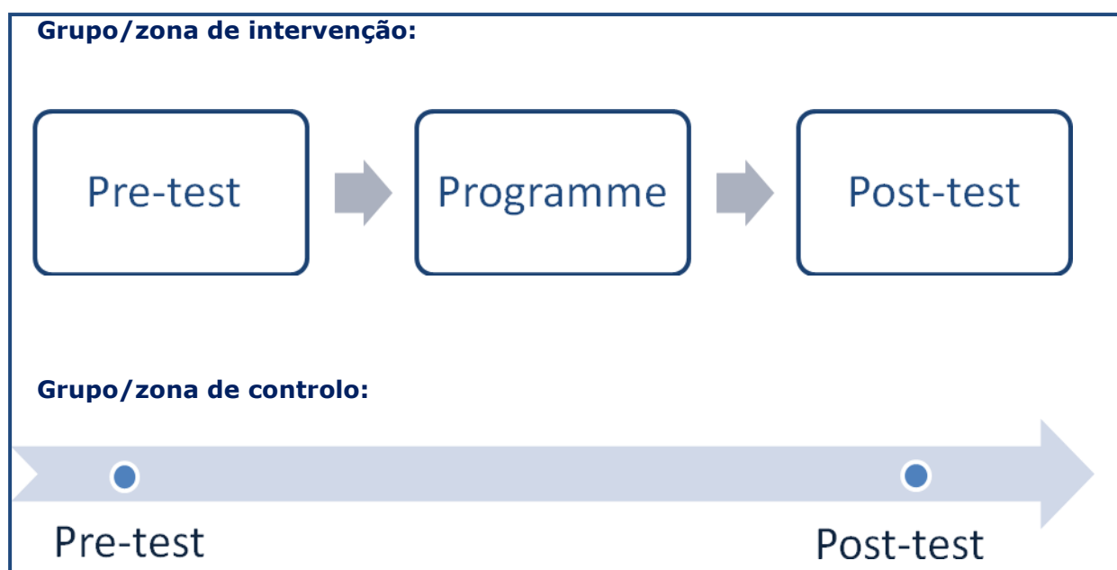
Figura 3: Exemplo de modelo (quase-)experimental de base

O modelo de avaliação quase-experimental teria assim a seguinte configuração: