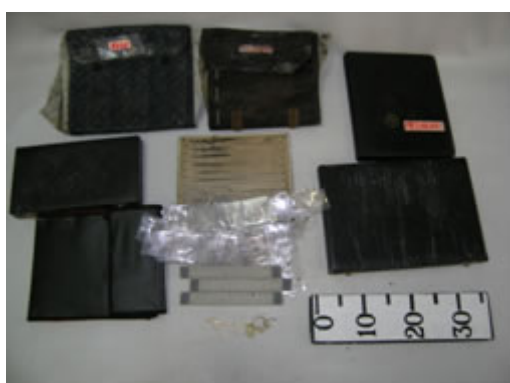
Foto 3 – Fotografia dos expositores e ouro que se encontrava no interior do saco