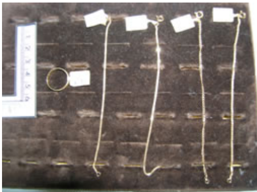
Foto 7 – Fotografias das quatro pulseiras de criança e de uma aliança